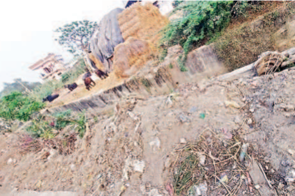
పట్టించుకోకపోవడంతో వార్డులో అభివృద్ధి ఎక్కడ వేసిన గొంగళి అక్కడే మాదిరిగా ఉంది. అధికారులు, స్థానిక కౌన్సిలర్ ఇప్పటికైనా చర్యలు తీసుకొని వార్డు అభివృద్ధిని పట్టించుకోవాలని ప్రజలు కోరుతున్నారు.

హుజూర్ నగర్ మున్సిపాల్టీ పరిధిలోని 5వ వార్డ్ లో గల సుందరయ్య నగర్ లో హిందు స్మశానవాటిక సమీపంలో ఉన్న పెద్ద డ్రైనేజీలో కొన్ని రోజుల క్రితం మున్సిపాల్టీ సిబ్బంది డ్రైనేజీ పూడిక తీసి పక్కనే వేశారు. అయితే తొలగించిన పూడిక అక్కడనుంచి తరలింపకపోవడంతో మట్టి చెత్త చెదారంతో పెద్ద గుట్టలా మారింది. ఇలా తొలగించిన పూడిక వెంటనే అక్కడ నుంచి తొలగించకపోవడంతో తిరిగి శుభ్రం చేసిన డ్రైనేజీలోకి పూడిక చెత్తా చెదారం గాలివాటం, వర్షపునీళ్ల వలన వెళ్లి మట్టి డ్రైనేజీ చెత్తా చెదారంతోనిండి దుర్వాసన రావడంతోపాటు పారిశుధ్య సమస్య మళ్లీ తలెత్తే అవకాశం ఉంది. మురికి కాలువను శుభ్రం చేసిన వెంటనే అక్కడ ఉన్న చెత్తను, మట్టిని తొలగించడంలో సిబ్బంది నిర్లక్ష్యంగా ఉండటంతో మళ్లీ సమస్య వచ్చే పరిస్థితి నెలకొంది. అలాగే 5వ వార్డ్ లో చాలాచోట్ల పారిశుధ్య సమస్యతోపాటు వీధి పంపుల నిర్వహణ సరిగా లేక తాగునీరు వృధా అవుతుంది. అలాగే వార్డ్ లో విపరీతమైన దోమల కారణంగా అనేక మంది విష జ్వరాల బారిన పడుతున్నారు. వార్డ్ నిర్వహణ చూడాల్సిన కౌన్సిలర్, సంబంధిత అధికారులు