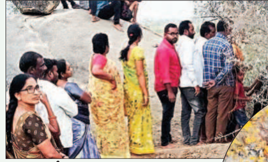
గరిడేపల్లి, మార్చి 8 ప్రభాతవార్త

సూర్యాపేట జిల్లా గరిడేపల్లి మండలం సర్వారం గ్రామ శివారులో ఉన్న నల్లగుట్టపై శివరాత్రి రోజైన శుక్రవారం శివలింగం కనిపించింది. శివరాత్రి పర్వదినం రోజున ఈ శివలింగం గుట్టపై పెద్దపెద్ద రాళ్ల మధ్య ఉన్న పుట్టలో శివలింగం బయటపడటంతో ఈవిషయం కొద్దిసేపట్లోనే దావానలా వ్యాపించింది. దీంతో బయటపడ్డ శివలింగాన్ని చూసేందుకు జనం నల్లగుట్ట వద్దకు తరలివస్తున్నారు. చూసేందుకు వచ్చిన భక్తులు పుట్ట వద్ద కనిపిస్తున్న శివలింగానికి పూజలు చేస్తున్నారు. శుక్రవారం ఉదయం కనిపించిన ఈ శివలింగం గరిడేపల్లి, కీతవారిగూడెం గ్రామానికి చెందిన పూజారులు వచ్చి శివలింగాన్ని బయటకు తీసి చూడగా దానిపై బ్రహ్మసూత్రం ఉన్నట్లు గుర్తించి అక్కడ ఉన్న స్థానికులకు విషయం చెప్పారు. జరిగిన సంఘటనపై వివరాలు ఇలా ఉన్నాయి.