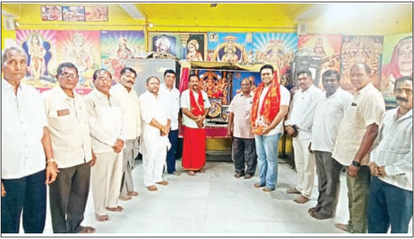
శివాలయాల్లో వేడుకలు భక్తిశ్రద్ధలతో నిర్వహించారు. తీర్థప్రసాదాల వినియోగంతో కార్యక్రమాలు ముగిసాయి.