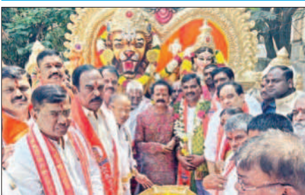
యాదగిరిగుట్ట ప్రభాతవార్త: యాదాద్రి శ్రీ లక్ష్మీనరసింహస్వామివారి